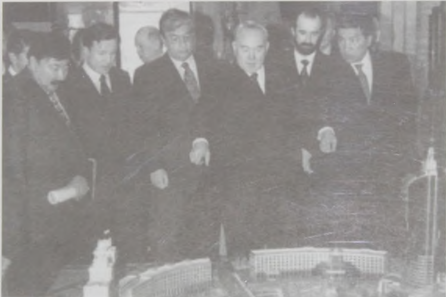
Президент РК Н. А. Назарбаев во время обсуждения дальнейшего развития Астаны, 27 марта 2002 г. Справа 1-й Премьер-министр Имангали Тасмаганбетов.