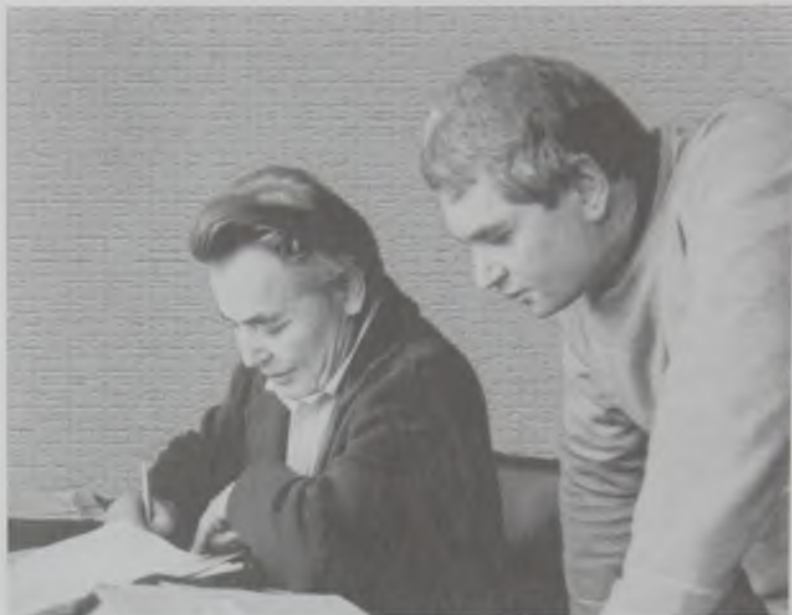
Известные писатели Абдижамил Керимович Нурпенсов и Герольд Карлович Бельгер.