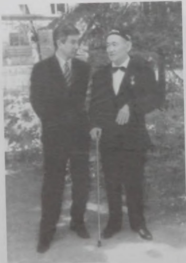
Иманғали Нұрғалиұлы Тасмағанбетовтың Халық Қаһарманы, композитор Нұрғиса Тлендиевтің наукастанып жатырған емханасына барған кезі, 1900.