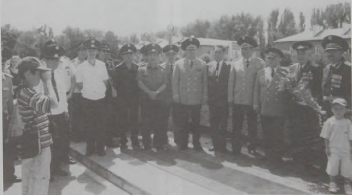
Аманжолов Керейхан Рахымжанұлы генерал-полковник Әлібек Қасымов бастаған офицерлер ортасында, әскери академия, маусым 2001 ж.