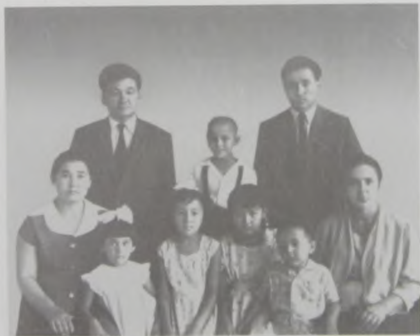
Билеубаев өз отбасында.