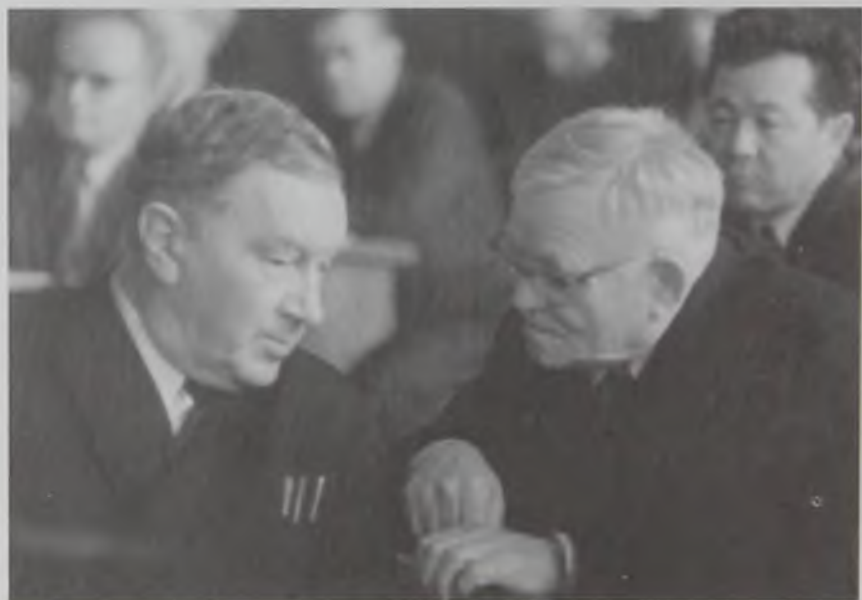
Шлыгин Е. Д. и академик АН СССР Наливкин Д.В. Копенгаген, 1960 г.