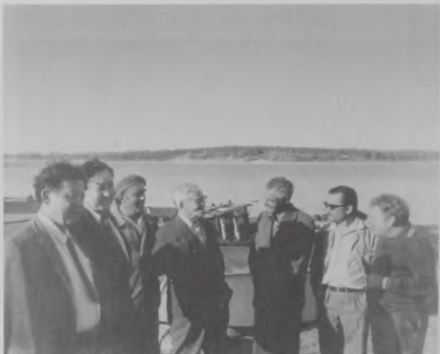
Слева А. Абдуллин — академик АН КазССР (1-ый), Есенов Шахмерден — академик, Президент АН КазССР (2-ой), Шлыгин Евгений Дмитриевич академик АН КазССР (4-ый).