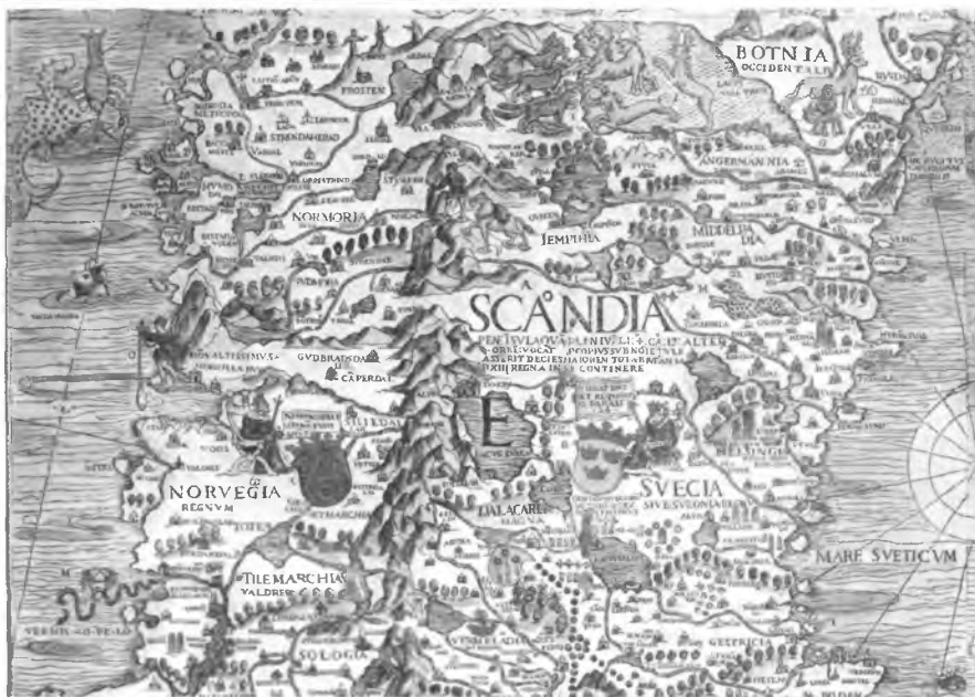
Фрагмент «Карты Марина»

Особый шарм придаёт ему старейший в стране университет и его библиотека, знаменитая «Каролина Редивива». Студенты в немалой степени определяют стиль жизни — узкие улочки, набережные сплошь заставлены велосипедами, основным здесь транспортным средством. Несмотря на каникулы, много студентов и в библиотеке, и в окружающем её Ботаническом саду.