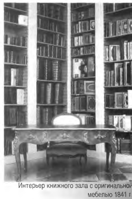
Интерьер книжного зала с оригинальной мебелью 1841 г.

Карту создавали в течение 12 лет, а первые копии были напечатаны в Венеции в 1539 г. Спустя несколько лет папа Павел III наложил вето на производство, и на несколько сотен лет «Карта Марина» была незаслуженно забыта. Лишь в