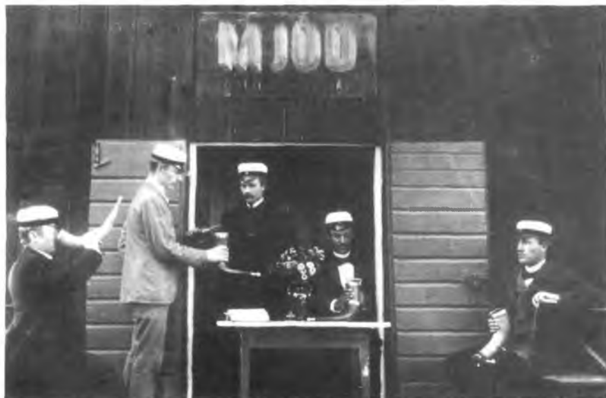
Студенты пьют медовуху в Старой Уппсале

Несмотря на свою «музейность», исполненные с большим вкусом и изяществом интерьеры и мебель, «Каролина Редивива» меньше всего напоминает мемориальное заведение. Здесь кипит