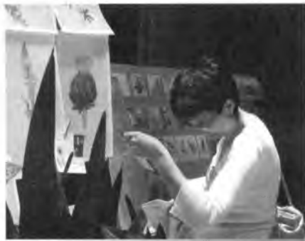
В Лавке эстампов

В библиотеке «Каролина Редивива» трудится 234 человека, ежедневно её посещают более 5 тысяч человек (всего пользователей 48 500), библиотека под-